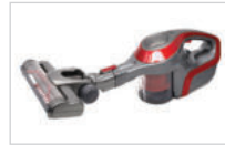
본체와 바닥 브러시를 바로 연결합니다.