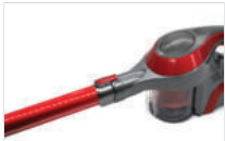
①연장관을 흡입구에 연결합니다.