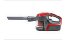
본체와 틈새 브러시를 연결합니다.