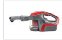
본체와 원형 브러시를 연결합니다.