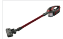
③연결한 청소기를 사용합니다.