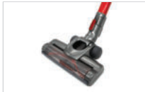
②바닥 브러시를 연장관과 연결합니다.