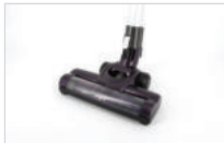
2. 바닥 브러시를 연장관과 연결합니다.