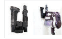
2. 거치대에 청소기를 보관하면 넘어지지도 않고 안전하게 보관할 수 있습니다.