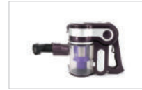
본체와 원형 브러시를 연결합니다.