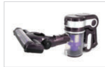
본체와 바닥 브러시를 바로 연결합니다.