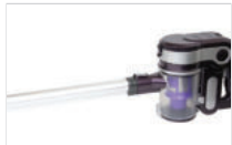
1. 연장관을 흡입구에 연결합니다.