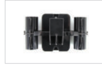
1. 적당한 높이에 거치대를 고정합니다.