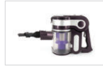
본체와 틈새 브러시를 연결합니다.